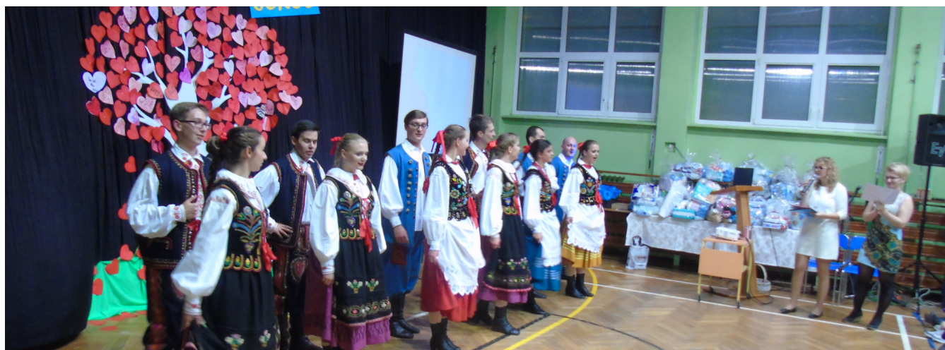
Zespół folklorystyczny Łódź