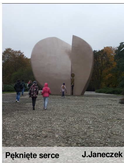
Pęknięte serce J.Janeczek