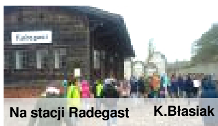
Na stacji Radegast K.Błasiak