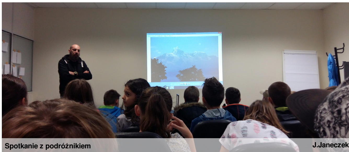
Spotkanie z podróżnikiem