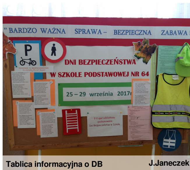
Tablica informacyjna o DB

Uczniowie klas IV- VII przygotowywali regulaminy obowiązujące w czasie wycieczek pieszych oraz autokarowych. Trzeba było również wykonać gazetkę związaną z tym tematem i wywiesić na drzwiach sali. Autorzy najciekawszych gazetek zostali wyróżnieni. Klasy czwarte układały słowa piosenki o ruchu drogowym na melodię przeboju Kai "Po co". Odbyło się głosowanie, który z tych tekstów jest najciekawszy. Zwyciężyła klasa IV e, która na apelu podsumowującym 9.października wykonała piosenkę i zatańczyła